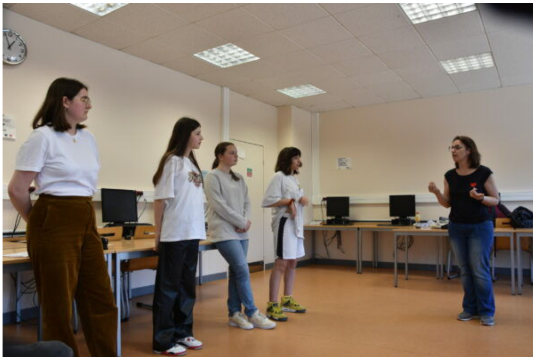
Atelier concours d'éloquence au collège Pierre de Nolhac à Versailles.

La finale du concours d'éloquence des collèges approche. Organisé par le Département des Yvelines, le concours permet à des élèves de 3e, aidés par des coaches en improvisation théâtrale, d'acquérir les clés du débat, de l'argumentation, pour convaincre un jury. Un exercice qui renforce aussi la confiance en soi. Les élèves adorent.